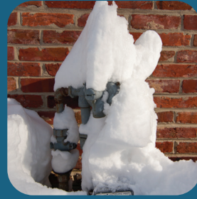
MEDIDOR SIN PROTECCIÓN PARA NIEVE