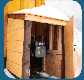
MEDIDOR CON PROTECCIÓN PARA NIEVE

La nieve y el hielo pesados que caen de los techos pueden dañar los medidores, los reguladores, y la tubería de gas natural relacionada. Se debe tener cuidado especial cuando se limpian los techos para evitar un impacto. También, la acumulación de nieve y hielo, ya sea natural o artificial, puede dañar los medidores de gas y los aparatos exteriores, y así crear una fuga peligrosa.